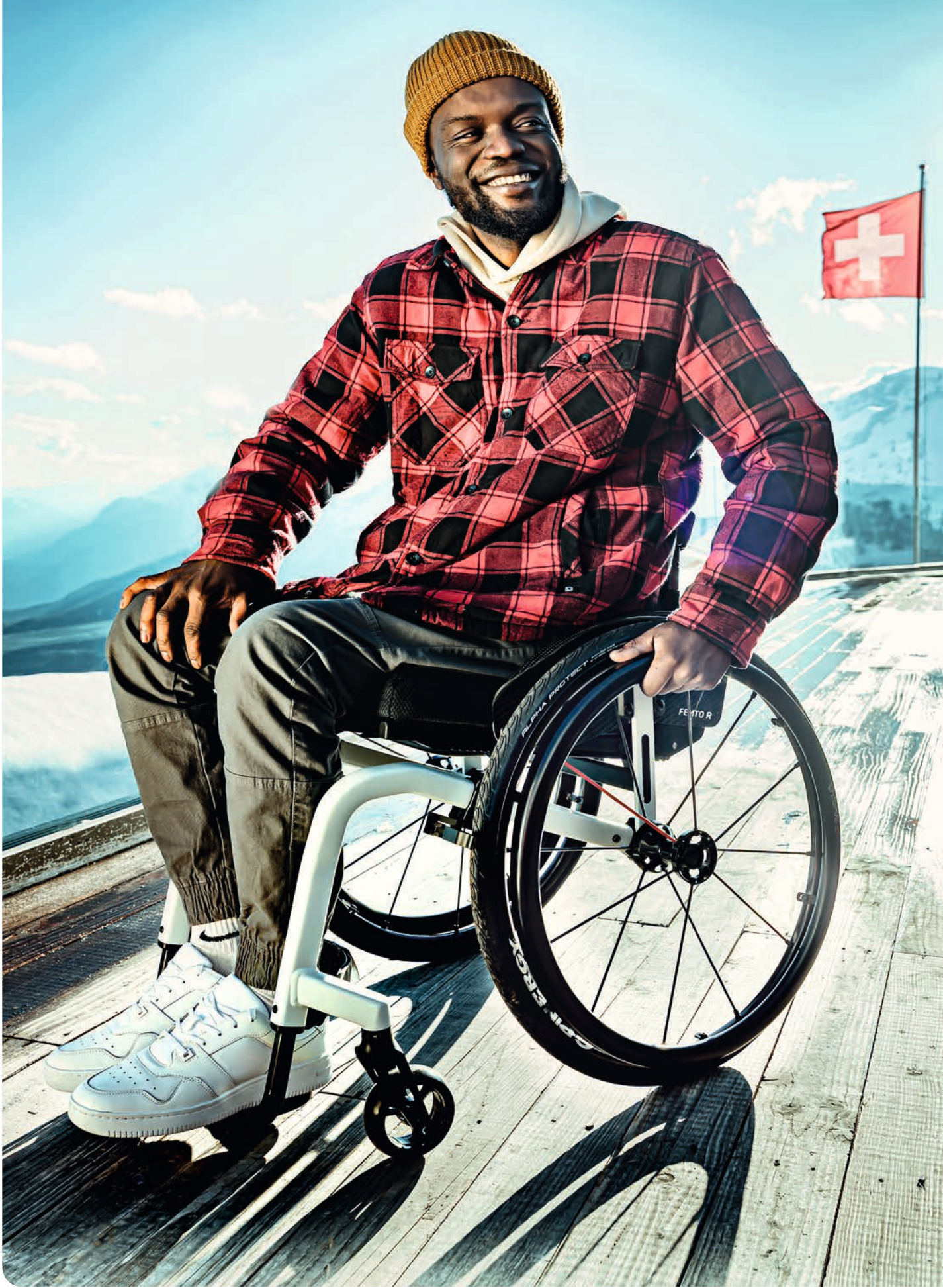
FIG. : FEMTO R