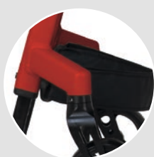
Possibilités d'ajustement dissimulées